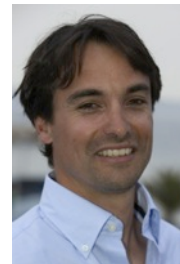
Benjamin BONNAUD Entraîneur de l'Équipe de France depuis 2013

« C'est la grande rentrée des classes pour les françaises ! C'est la première fois que 5 équipes récemment constituées sont engagées dans un championnat de ce niveau. Le recrutement national organisé au printemps dernier par la FFVoile a permis de contacter une trentaine de candidates. 18 d'entre elles ont pu essayer le bateau et échanger sur leur projet : 12 ont été retenues. Les binômes