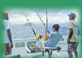
Simulateur de pêche au gros