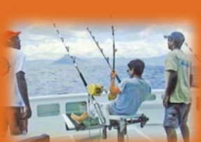
Simulateur de pêche au gros