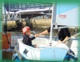
Simulateur de voile