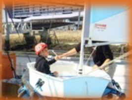
Simulateur de voile